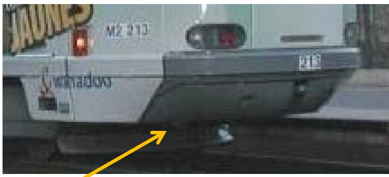
Exemple de chasse-obstacle positionné sur la largeur du bogie (Tramway de Paris)

Les exigences de la norme EN 15227 s'appliquent.