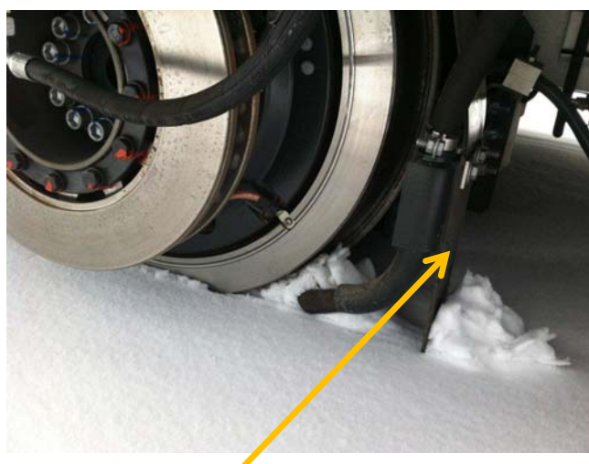
Exemple de chasse-obstacle positionné devant la roue (Tramway de Dijon)